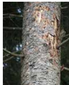
Spechte haben die Fraßgänge aufgehackt (Spechtspiegel)