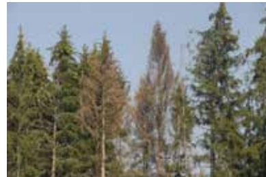
Befallene, rotgefärbte Kronen

Die Gefährdung von Fichtenbeständen durch Borkenkäfer, insbesondere dem sogenannten Buchdrucker, ist durch die Trockenheit und hohen Temperaturen sehr hoch. Deshalb sollen die Waldbesitzerinnen und Waldbesitzer ihre Waldbestände regelmäßig kontrollieren. Mögliche Anzeichen und Befallsbilder sind: