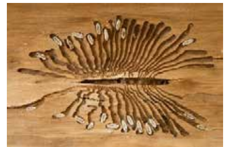
Brutbild des Buchdruckers mit weißen Käferlarven.

Sollten diese Befallsbilder auftreten, ist Eile geboten, und die befallenen Bäume müssen gefällt und die befallenen Stammteile möglichst schnell aus dem Wald gebracht oder unschädlich gemacht werden. Weitere Infos auf dem Borkenkäferportal der Landesanstalt für Wald und Forst www.lwf.bayern.de/waldschutz/monitoring/065609/index.php